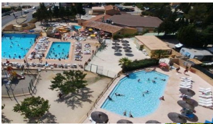
Camping Lou Soleil***