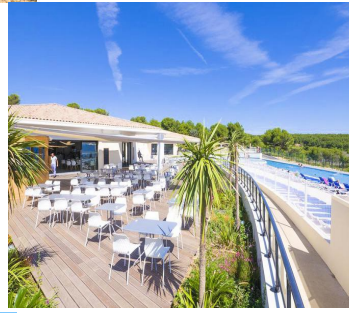
Camping l'Arquet ****