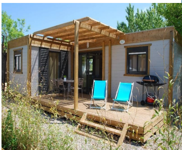
Camping Marius ***